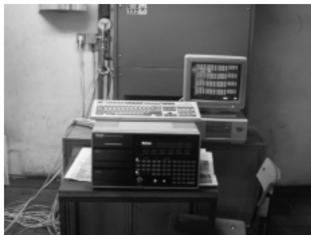
3 Prenosni sistem za zajemanje podatkov priključen na peč 3 Portable system for data acquisition connected to the furnace