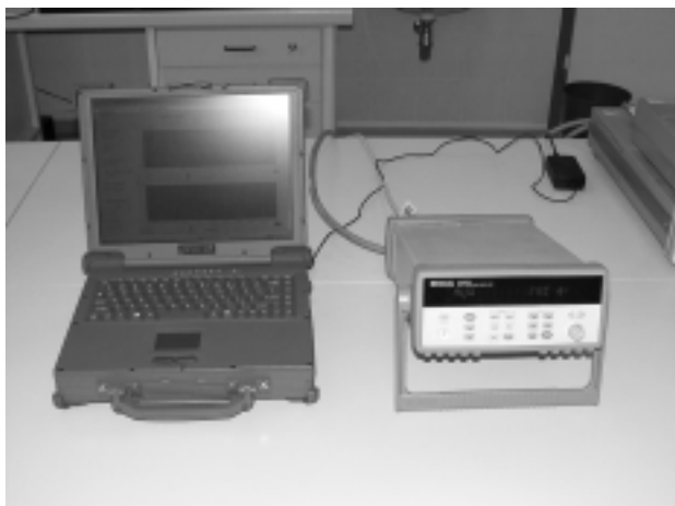
2 Industrijski prenosni računalnik "Getac" in "data logger" HP 2 Industrial portable PC "Getac" and data-logger HP