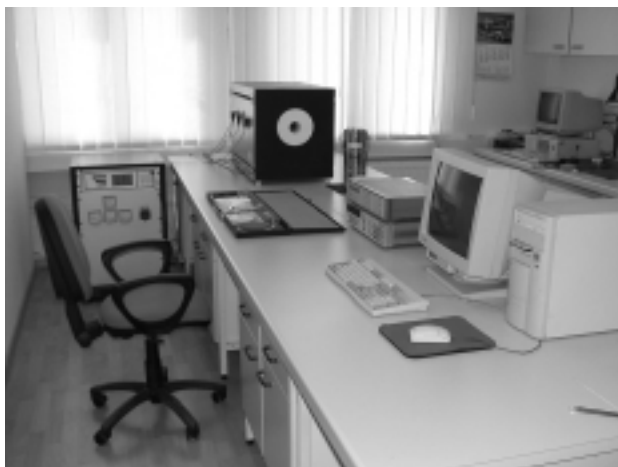
1 Laboratorijska oprema za umerjanje termoelementov

mogoče izvajati samo občasno na preskusnih gredicah. Potek ogrevanja vseh gredic v peči, ki imajo zaradi diskontinuirnega dela različne temperaturne profile ogrevanja, lahko spremljamo samo z matematičnim modelom, ki deluje v realnem času. Za prilagajanje modela realnemu objektu je potrebna primerjava rezultatov izračunov z rezultati meritev temperaturnih profilov na različnih merilnih mestih po prerezu in dolžini gredic.